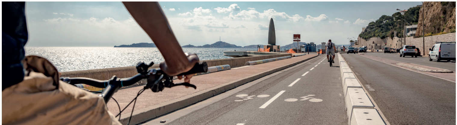
PISTE CYCLABLE CORNICHE KENNEDY - MARSEILLE