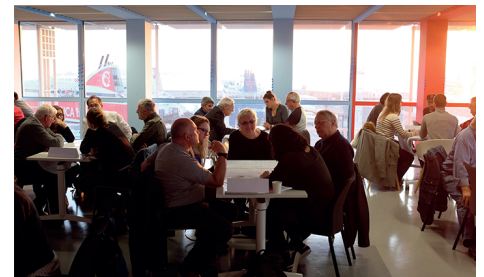
CONCERTATION PUBLIQUE ELABORATION PDU 2020-2030 AIX-MARSEILLE-PROVENCE ATELIER

» Lancée en 2018, le processus s'est achevé en octobre 2019.