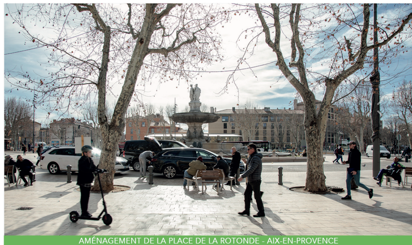
AMÉNAGEMENT DE LA PLACE DE LA ROTONDE - AIX-EN-PROVENCE