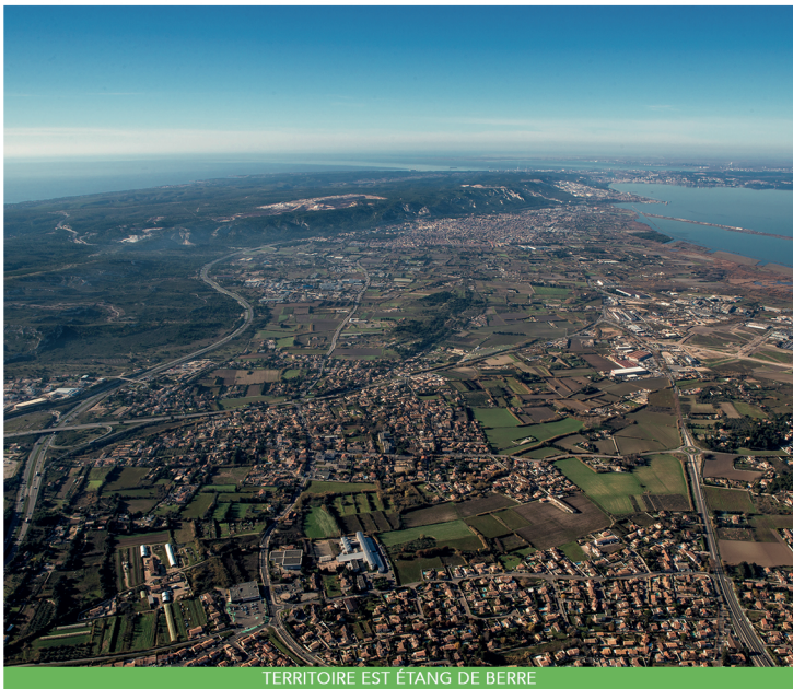
TERRITOIRE EST ÉTANG DE BERRE