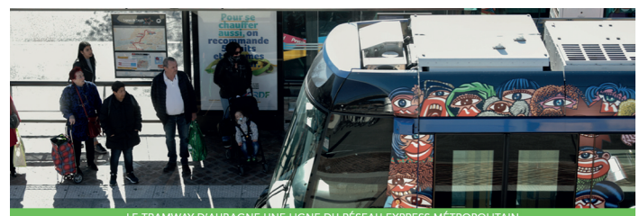
LE TRAMWAY D'AUBAGNE UNE LIGNE DU RÉSEAU EXPRESS MÉTROPOLITAIN