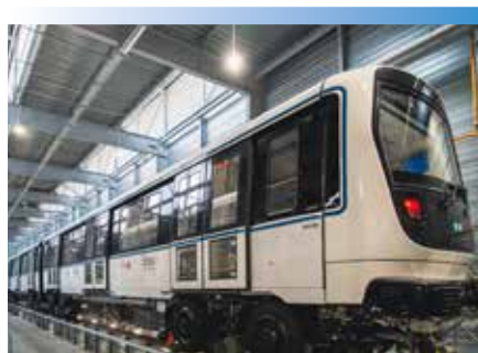
Photo : NEOMMA - Rame de métro assemblée au sein des ateliers RTM - Marseille