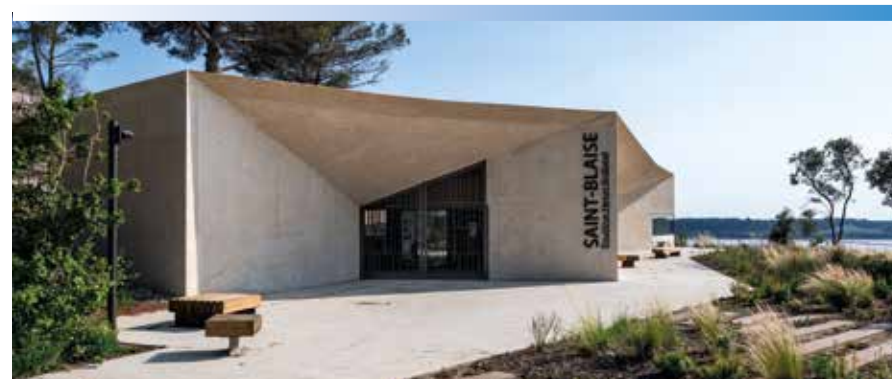
Photo : Pavillon Henri Rolland - Site archéologique de Saint-Blaise - Saint-Mitre-les-Remparts