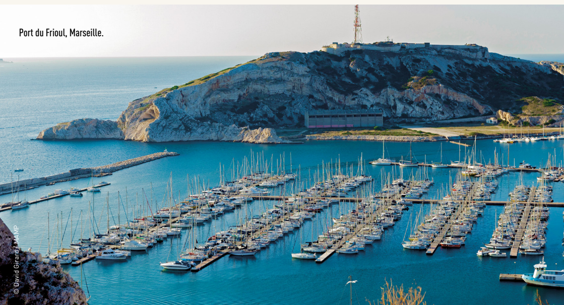
Port du Frioul, Marseille.