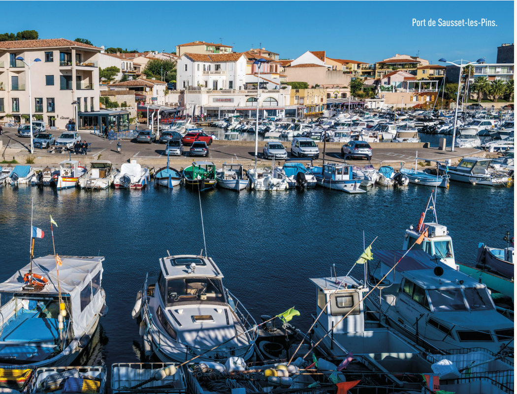
Port de Sausset-les-Pins.