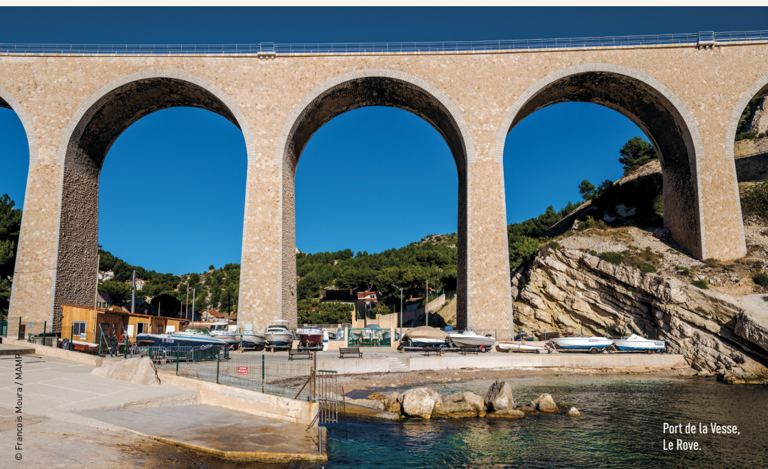
Port de la Vesse, Le Rove.

Toute perte de matériel dans l'ensemble des eaux portuaires (ancres, chaînes, moteur hors-bord, engins de pêche) doit être déclarée sans délai à la capitainerie. Le relevage du matériel ainsi perdu est entrepris aussitôt sous la responsabilité et aux frais du propriétaire. ▀