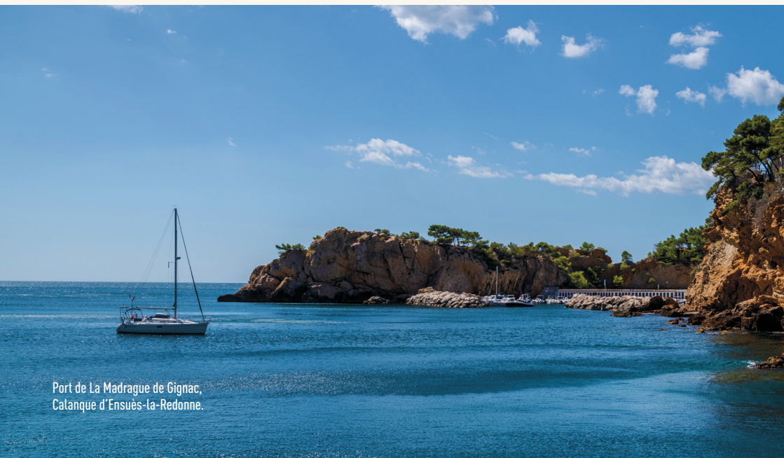
Port de La Madrague de Gignac, Calanque d'Ensues-la-Redonne.

En cas de refus ou d'absence de réponse dans le délai mentionné, il sera procédé à la radiation du candidat sur la liste d'attente de la catégorie du port concernée.