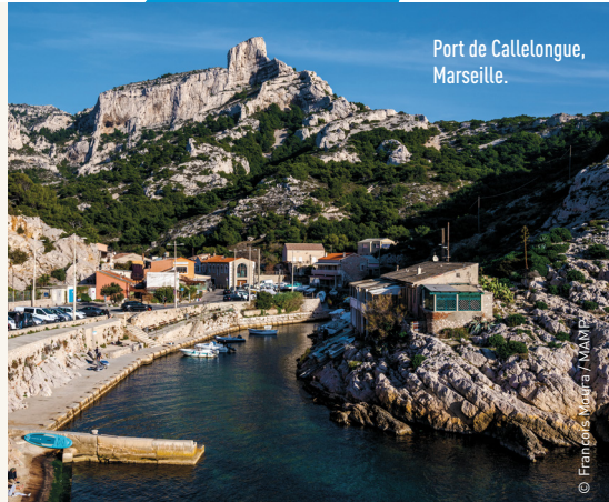
Port de Callelongue, Marseille.