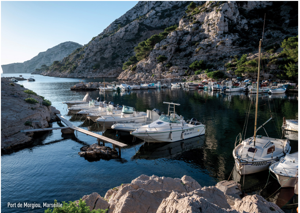
Port de Morgiou, Marseille