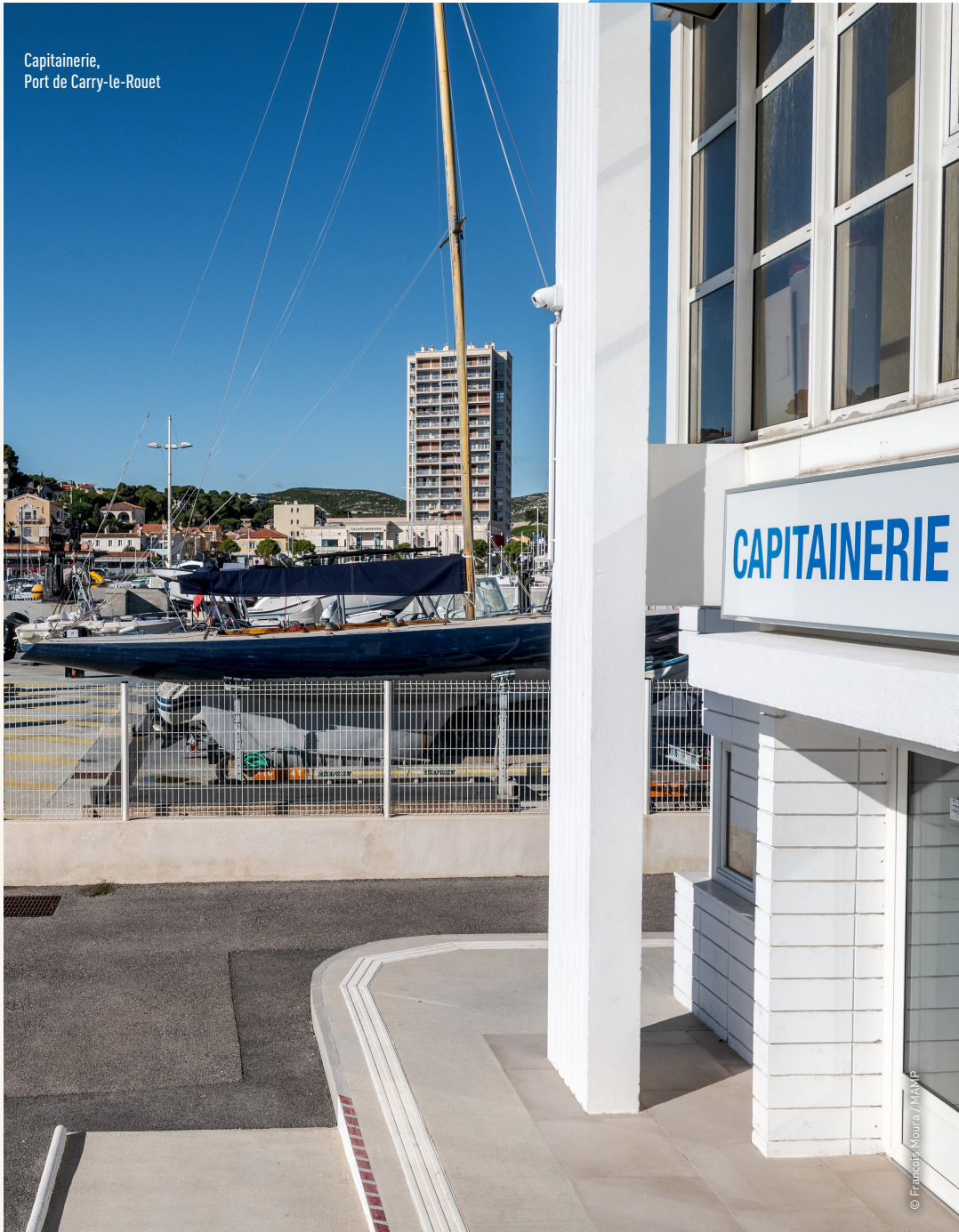
Capitainerie, Port de Carry-le-Rouet