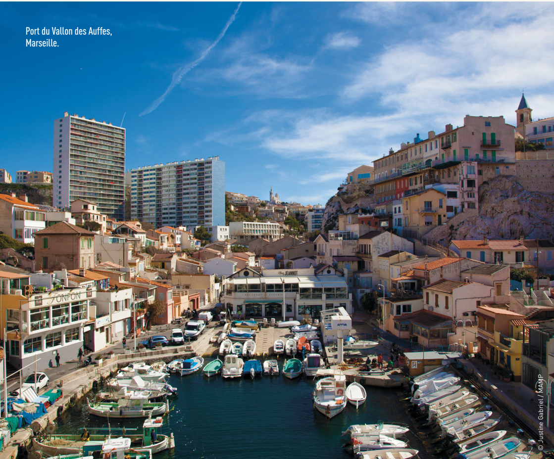
Port du Vallon des Auffes, Marseille.

L'exploitant du port ne sera pas responsable, sauf s'ils résultent d'un défaut d'entretien normal de l'ouvrage, des accidents et de leurs conséquences pouvant survenir aux usagers et à leurs invités, soit en circulant sur les passerelles, pontons, catways ou tout autre ouvrage portuaire, soit en embarquant ou débarquant de leur navire.