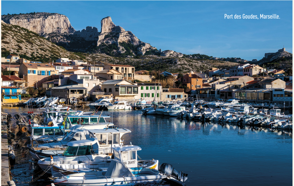
Port des Goudes, Marseille.