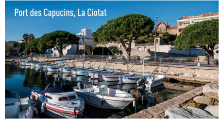
Port des Capucins, La Ciotat