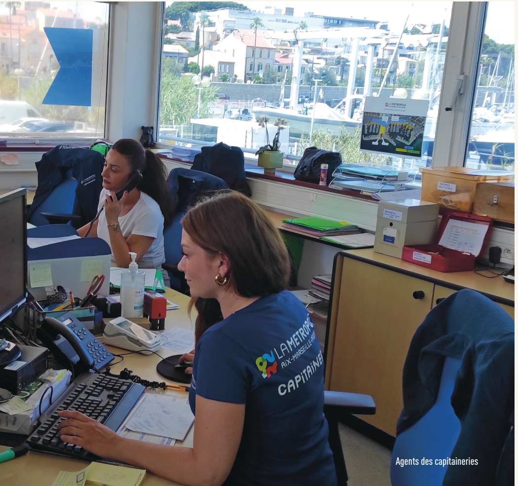
Agents des capitaineries