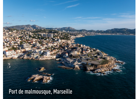
Port de malmousque, Marseille