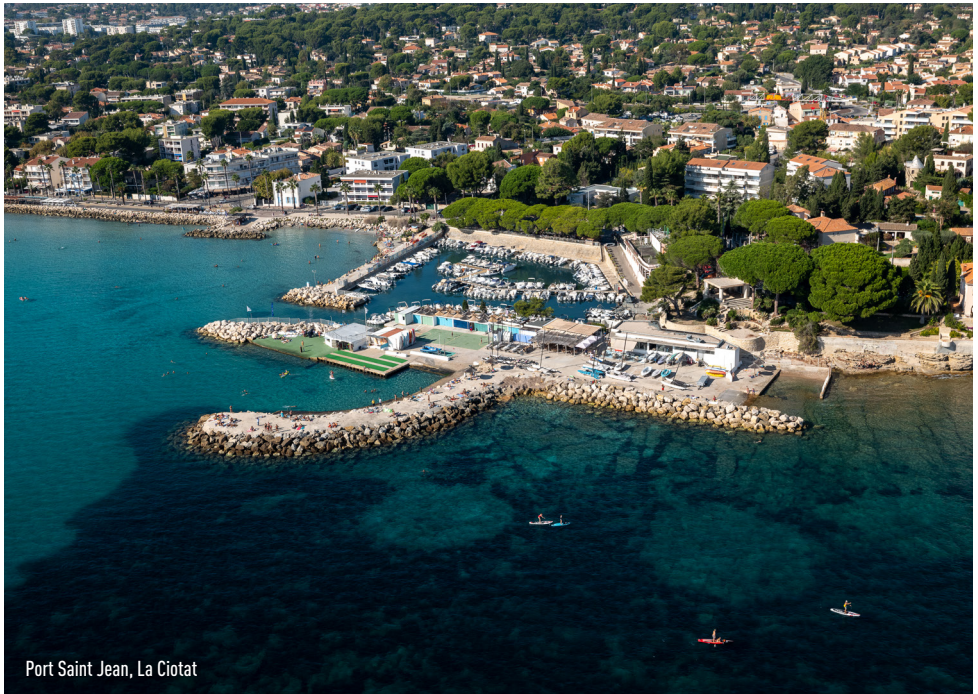
Port Saint Jean, La Ciotat