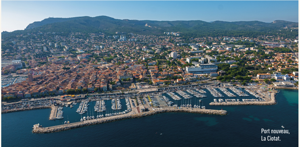
Port nouveau, La Ciotat.