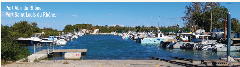
Port Abri du Rhône, Port Saint Louis du Rhône.