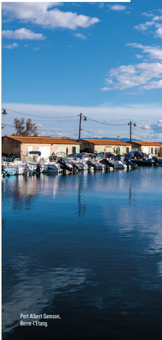
Port Albert Samson, Berre-l'Étang.

Ces attributions s'effectuent directement ou sur proposition des délégataires de gestion portuaire ou des sociétés nautiques, conformément aux dispositions de leurs contrats respectifs et au présent Règlement. ▶