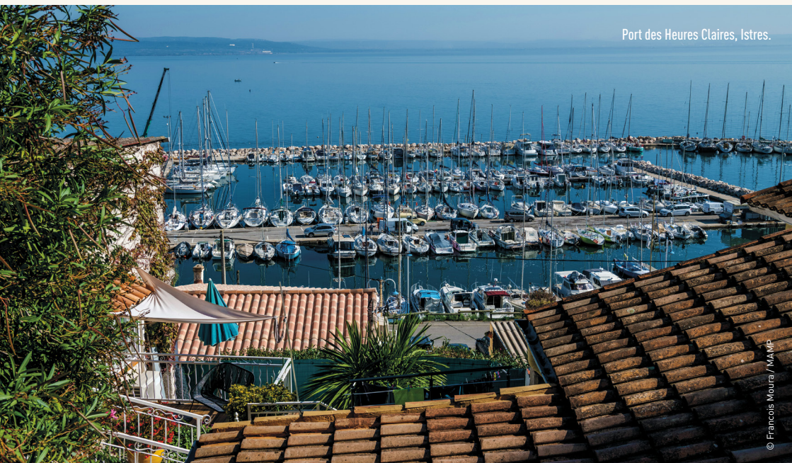
Port des Heures Claires, Istres.

Le défaut de paiement de la redevance dans les cinq jours suivant la date ultime de