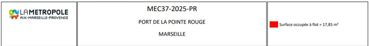
Plan non dimensionné à l'échelle