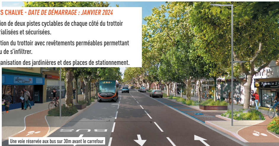
Une voie réservée aux bus sur 30m avant le carrefour