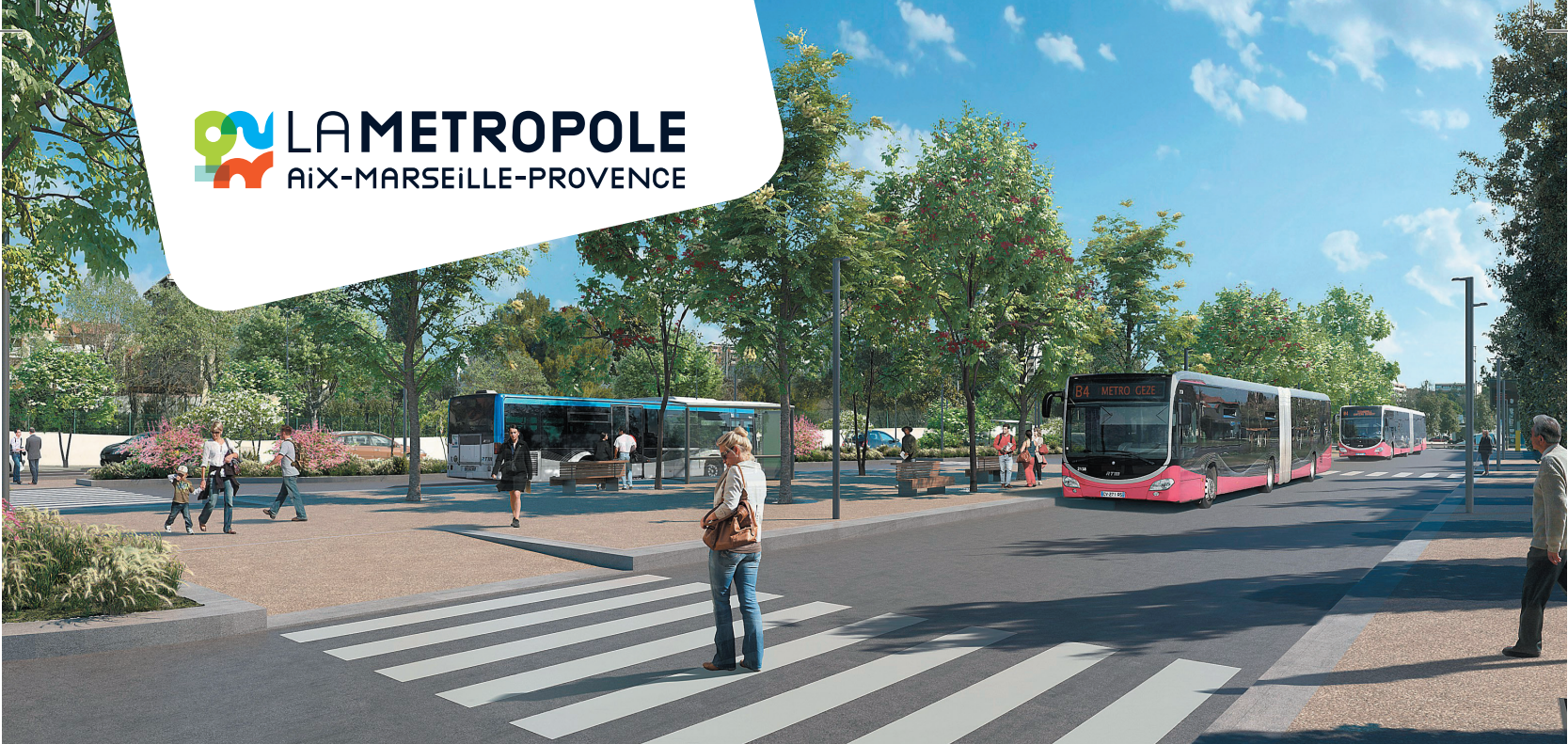
Pôle d'échanges multimodal de La Fourragère