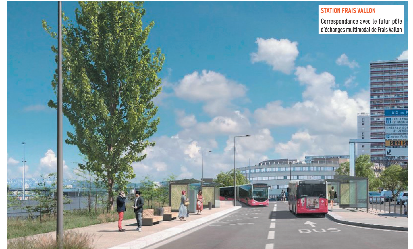
STATION FRAIS VALLON Correspondance avec le futur pôle d'échanges multimodal de Frais Vallon

Une des particularités de cette ligne est qu'elle empruntera le tunnel de Montolivet sur la L2 à partir de Frais Vallon pour ressortir à l'échangeur de Saint-Julien. Elle pourra ensuite poursuivre son itinéraire dans des couloirs en site propre jusqu'au pôle d'échanges multimodal de La Fourragère.