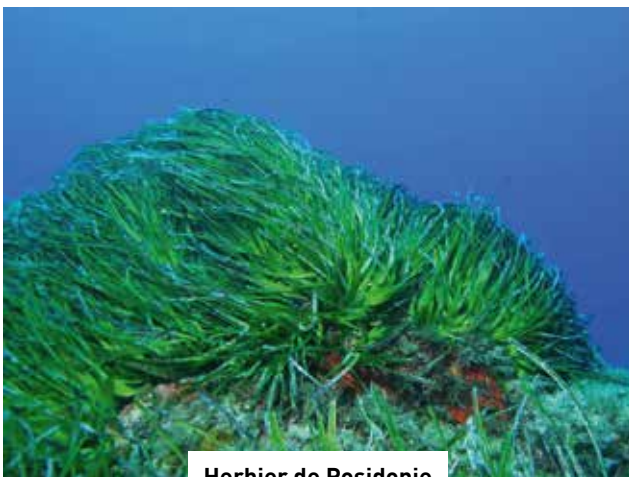
Herbier de Posidonie