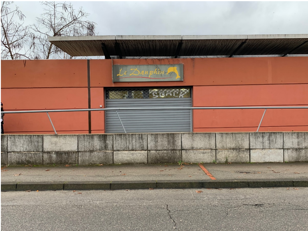
Accès voie publique