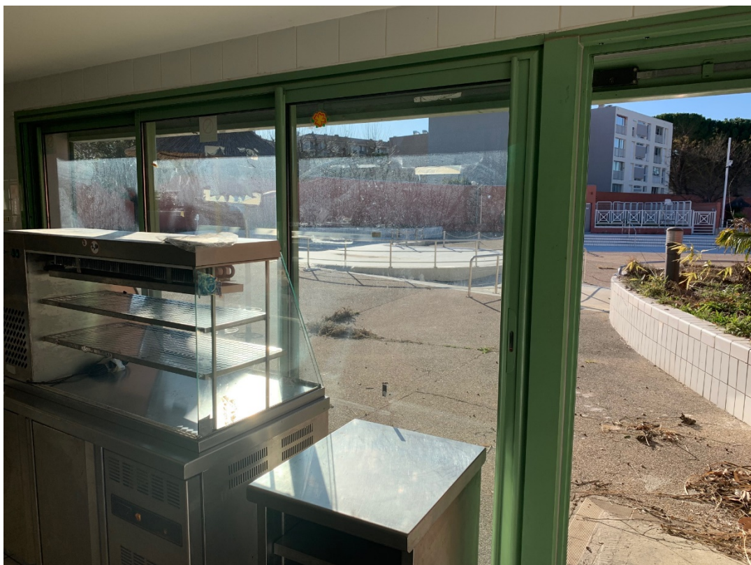
Espace de vente