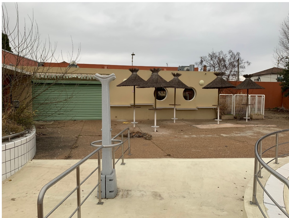
Accès coté piscine